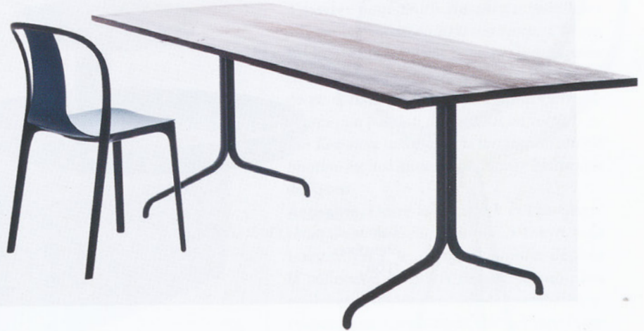
Chaise et table Chair and table Belleville , VITRA.