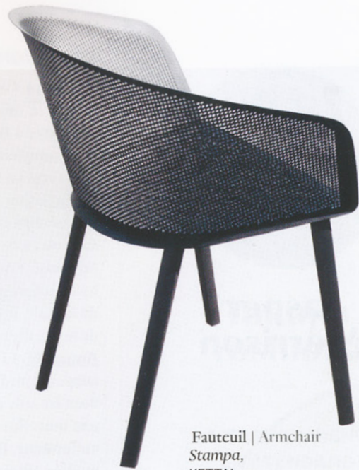
Fauteuil | Armchair Stampa , KETTAL.