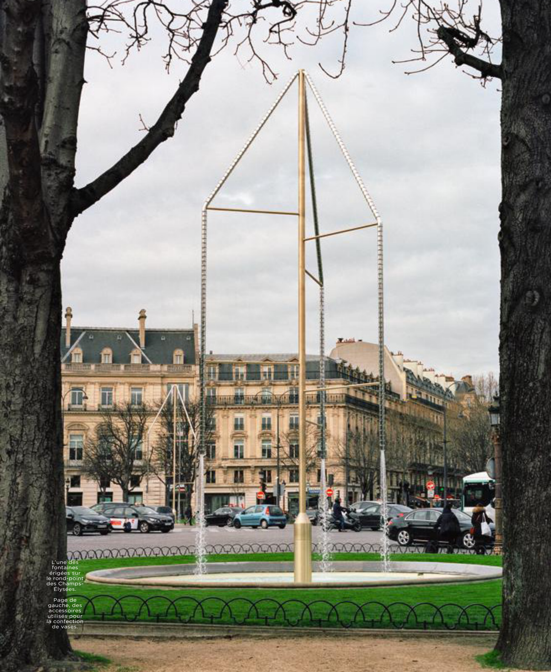
L'une des fontaines érigées sur le rond-point des Champs-Élysées.

Page de gauche, des accessoires utilisés pour la confection de vases.