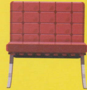
Barcelona (Ludwig Mies van der Rohe / Knoll)