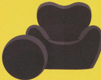
Up 5 & 6, La Mamma (Gaetano Pesce / B&B Italia)