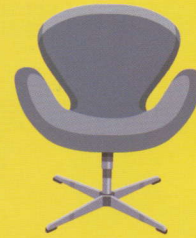
Swan (Arne Jacobsen / Fritz Hansen)