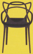
Masters (Philippe Starck / Eugeni Quitllet / Kartell)