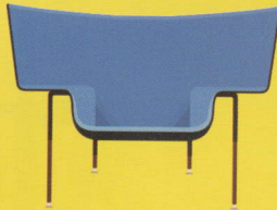
Capo (Doshi & Levien / Cappellini)