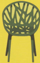
Vegetal (Erwan et Ronan Bouroullec / Vitra)