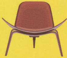
Shell (Hans Wegner / Carl Hansen & Son)