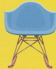
RAR (Charles et Ray Eames / Vitra)