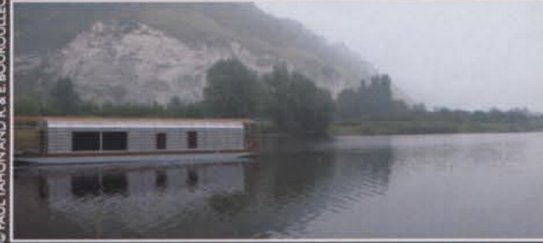
© PAUL TAIHON AND R. & E. BOUROULLEC