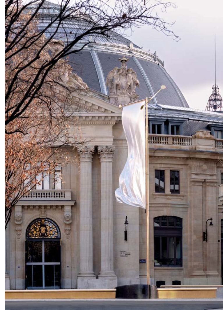
CLAIRE LAVABRE, STUDIO BOURULLEC; COURTESY BOURSE DE COMMERCE - PINAULT COLLECTION